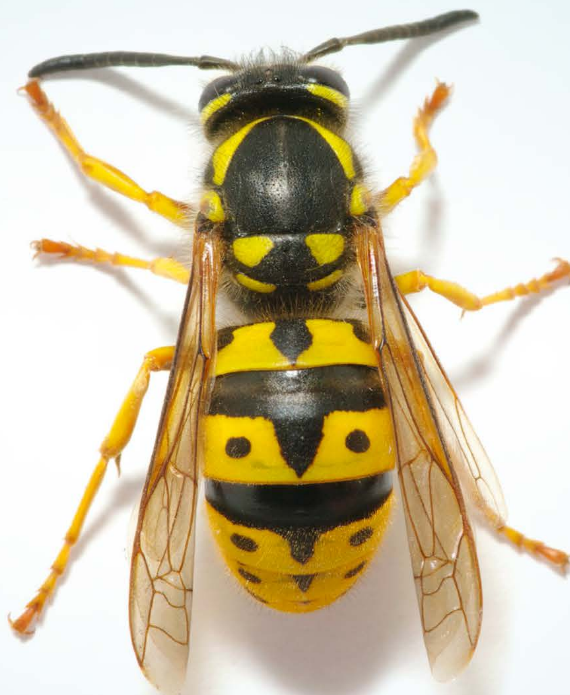
- Avispa Reina