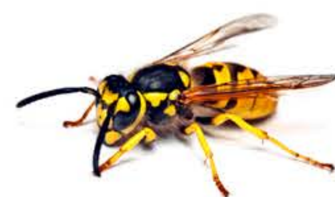
- Avispa obrera

Si no has hecho control de reinas, usa el mismo tipo de trampa para avispas obreras, pero reemplaza el vinagre por agua e instala en la parte superior un trozo de carne, pescado o embutidos como cebo.