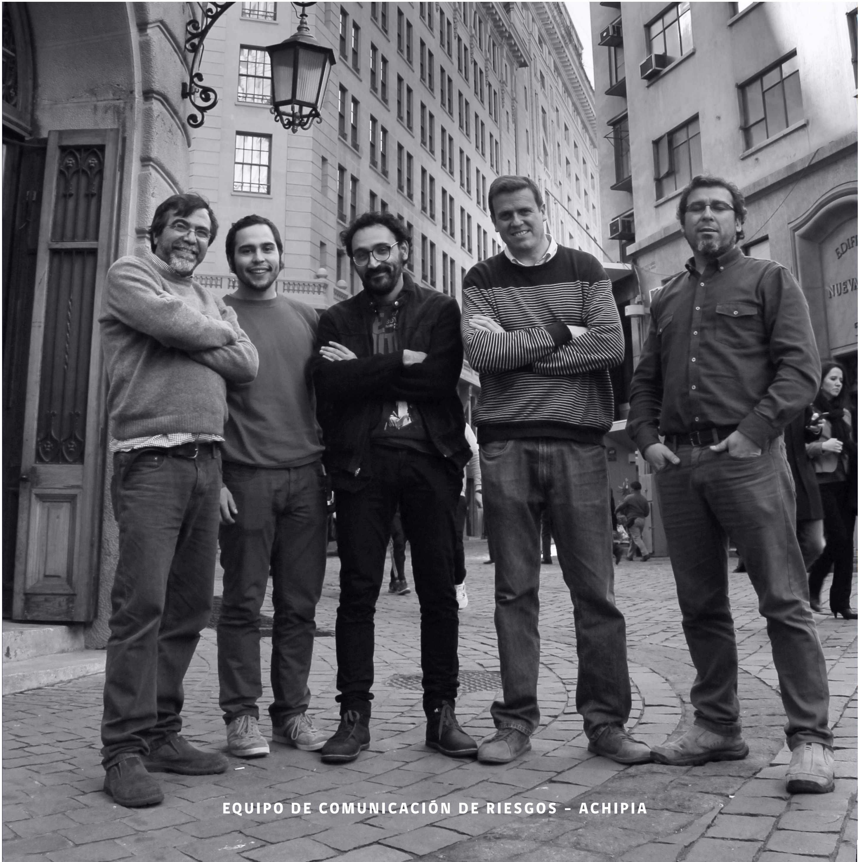
EQUIPO DE COMUNICACIÓN DE RIESGOS - ACHIPIA