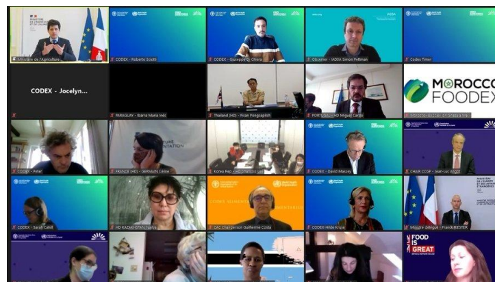
Delegados durante las discusiones técnicas.

Dentro de los temas tratados durante la reunión están la información sobre las actividades de la FAO y la OMS pertinentes a la labor del Comité, la orientación sobre los procedimientos para los comités que trabajan por correspondencia, enmiendas de textos del Codex y el formato y estructura del Manual de Procedimiento, entre otros.